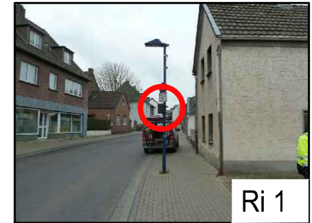
vor Hausnr. 66b